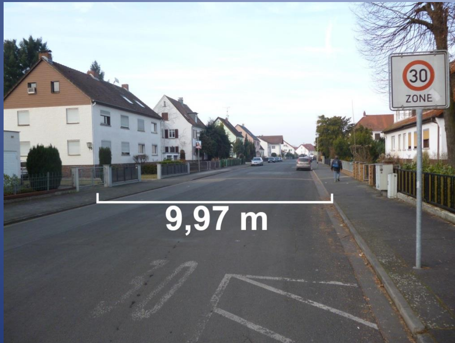
Goethestraße in Großauheim:

In den 70er Jahren wurde Hanau autogerecht ausgebaut.