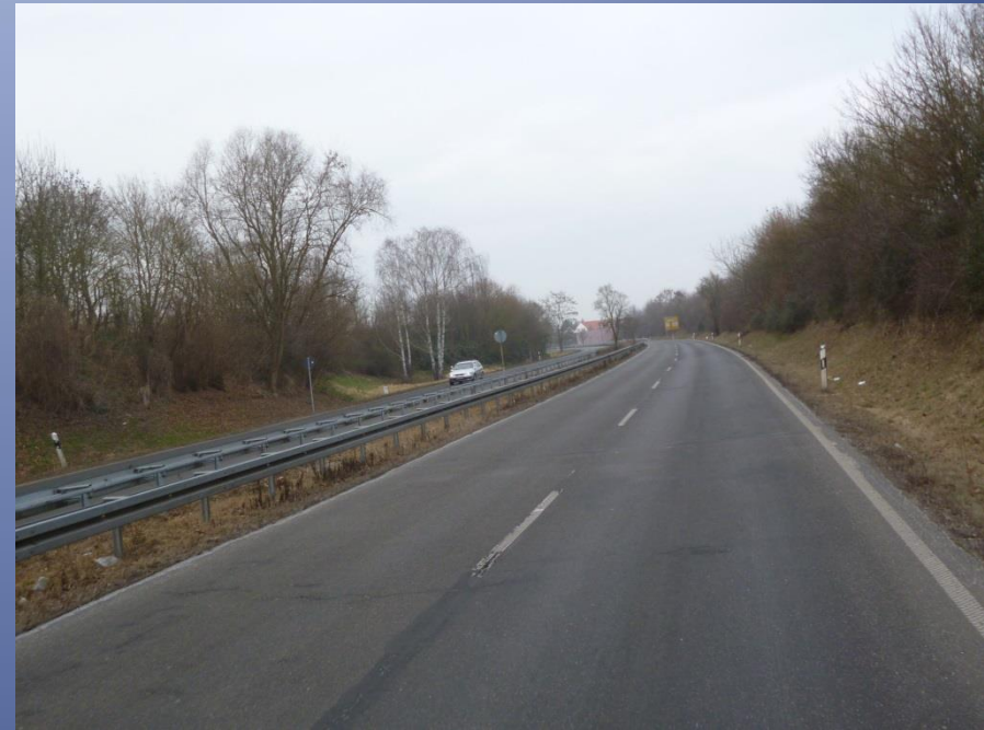
Breite Straßen, wenig Autos: L 3309 innerhalb von Großauheim

1.400 KFZ in der Spitzenstunde, zum Vergleich 3.200 KFZ in der Lamboystraße Quelle VEP 1996