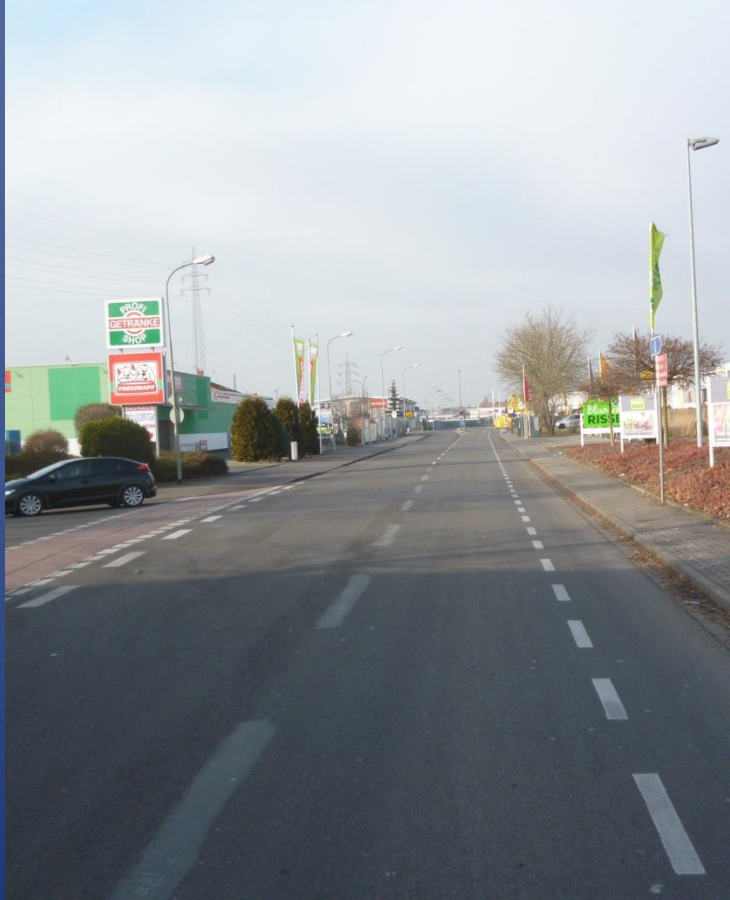
Schutzstreifen in der Benzstraße