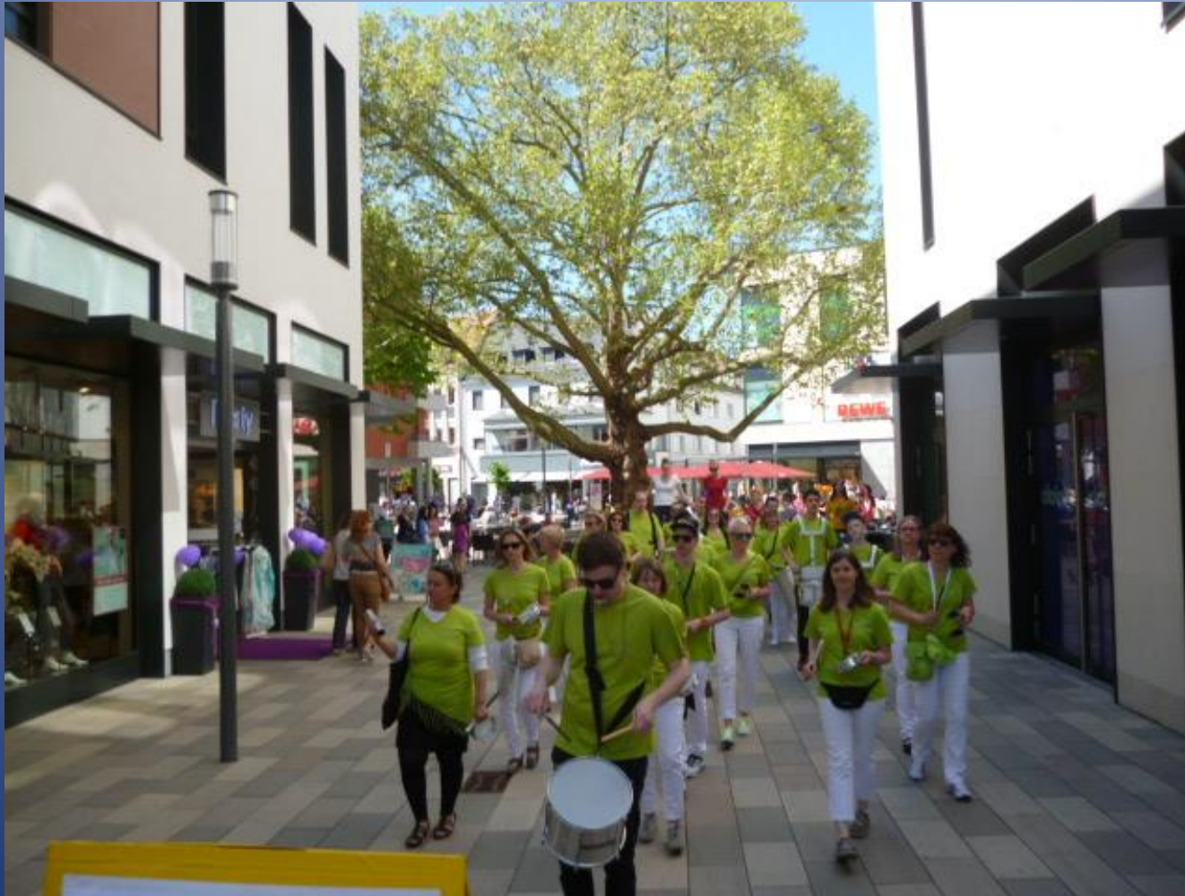
Hanau Forum Fahrradaktionstag