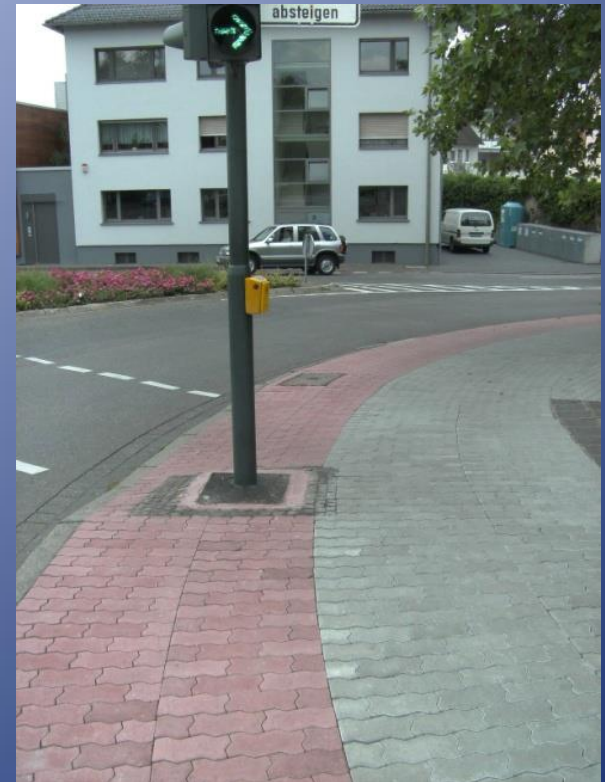
geteilter Bürgersteig mit Hindernis Kinzig-Brücke