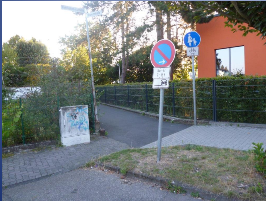
Westbahnhofstraße im Kinzdorf vorher