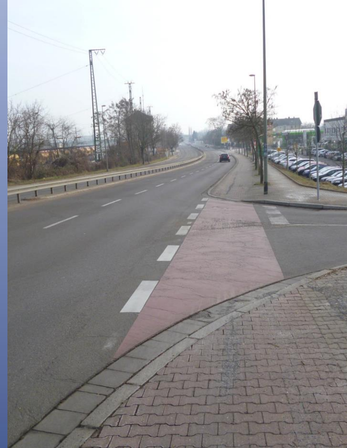
Auheimer Str. / Krawallgraben Unfallgefahr durch Zweirichtungsrادweg