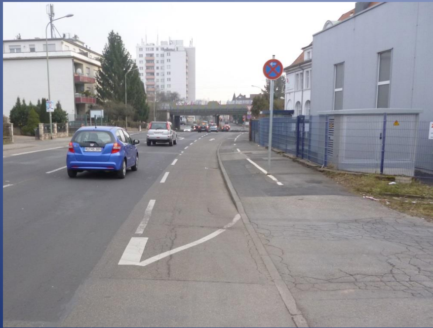
Offenbacher Landstraße in Steinheim